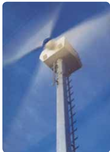
Szélturbina , horganyzott acéllétrával

Ezen zuhanás gátló és rögzítő eszközök felhasználási területei: távközlés, rádió és TV tartóoszlopok, építkezések, erőművek, vízi erőmű telepek, szélerőművek, kémények, ipari üzemek, épületek és homlokzatok, olajfinomító üzemek, szárazföldi és vízi olajfúró tornyok, hajógyárak, daruk, járatok és aknák, repülőgép hangárok, vonatok és járművek ki- és berakodása.