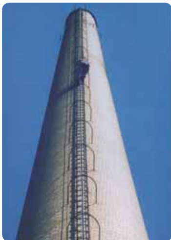
Kémény , átalakított vezetősínnel