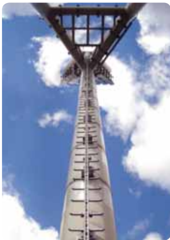
Stadion fényoszító tartó oszlop horganyzott acéllétrával

Söll GlideLoc® egy zuhanás gátló rendszer fixen beépítve épületekre, tornyokra, tartó oszlopokra stb. Magában foglalja a vezetett típusú zuhanás gátlót , mely le- ill. fölcsúszik az alumínium vagy acél vezető sínen . A sínek illeszthetők meglévő létrákhoz , vagy kiépíthetők egy komplett biztonsági mászó rendszerként . Tartóelemek széleskörű választéka áll rendelkezésre a legkülönbözőbb szerkezetekhez való rögzítéshez.