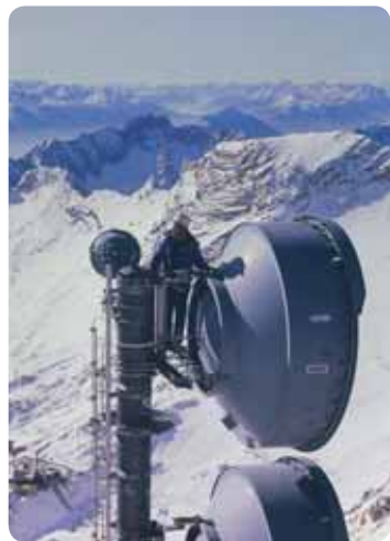
Telekom állomás alumínium létrával a Zugspitze-en